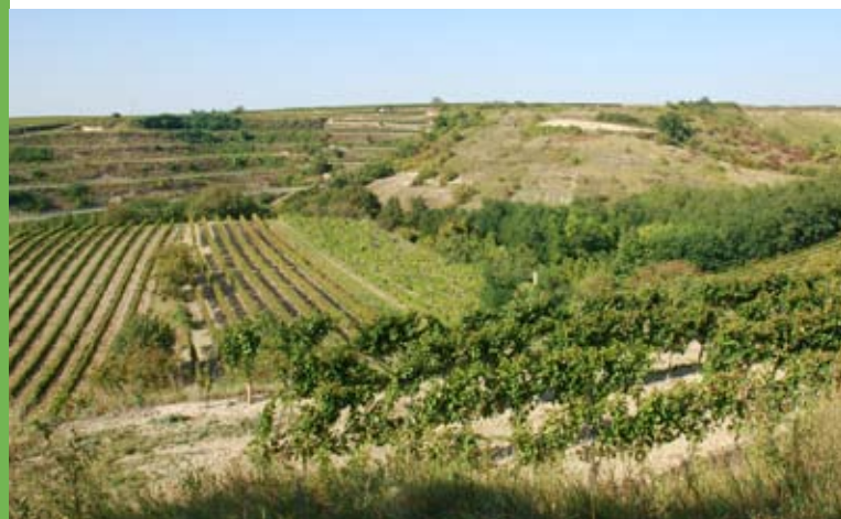
Die reich strukturierte Kulturlandschaft um Haugsdorf ist ein wichtiger Lebensraum für den Steinkauz.

Durch ein spezielles Artenschutzprogramm versucht die Naturschutzabteilung des Landes Niederösterreich das Überleben des Steinkauzes zu sichern: So wird etwa im Raum Retzbach und im Pulkautal die Anlage von Brachen mit Obstbäumen gefördert. Gestaffelte Pflegetermine sollen gewährleisten, dass stets auch kurzrasige Bereiche vorhanden sind, wo der Steinkauz leicht diverse Kleintiere erbeuten kann.