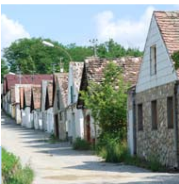
Charakteristische Kellergasse in Haugsdorf.

Wegbeschreibung: Vom Bahnhof Retz führt die Radroute über den historischen Retzer Hauptplatz durch das Verderberhaus über die Windmühlgasse steil zur Retzer Windmühle mit den umgebenden Trockenrasen hinauf. Von dort genießen wir den Ausblick auf Retz und die Weinbaulandschaft und folgen dem Weg weiter nach Osten Richtung Hofern. Nach ca. 200 m biegen wir auf einer kleinen Trockenrasenkuppe nach rechts in einen asphaltierten Weg Richtung Altstadt ab, der hinunter ins Tal führt. Achtung: ein Teilstück ist sehr grob gepflastert!