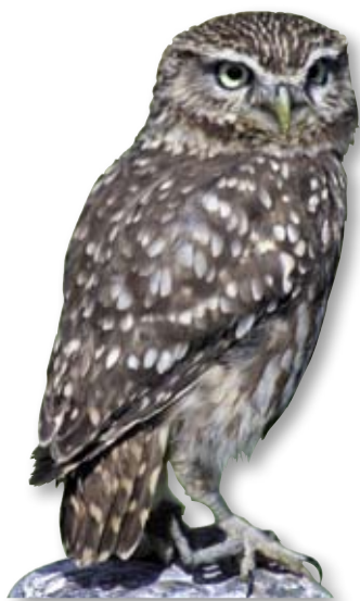
Der Steinkauz lässt sich an seinen hellgelben Augen leicht erkennen.

Der Steinkauz kommt in Österreich heute nur noch im nördlichen Niederösterreich, im Mostviertel, im Wiener Becken und im nördlichen Burgenland vor. Die vom Aussterben bedrohte Eule erreicht die Größe einer Singdrossel und brütet in Höhlen. Baumreiche Wiesen und Streuobstgärten, die besonders im Bereich traditioneller Ortsränder und Kellergassen vorkommen, sind für sie besonders wichtig.